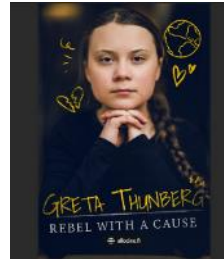
Greta Thunberg, Rebel with a cause (Waterbear.com)