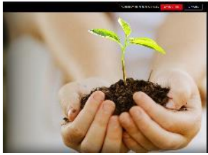
Kiss the ground (Netflix)

Wij genoten van deze documentaires, hoopvol en ontroerend (ja, echt, ontroerd door een inktvis, wij zagen 'm ook niet aankomen):