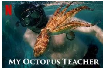
My octopus teacher (Netflix)